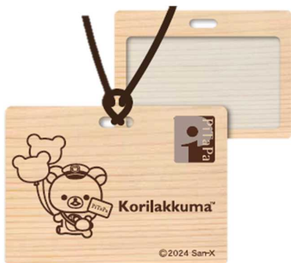
例：コリラックマ IC カードケース（当選グッズは他にもございます）

キャンペーンの詳細は、PiTaPa ホームページをご覧ください（キャンペーン特設サイトは 2024 年 12 月 16 日（月）10 時（予定）よりオープンいたします）。