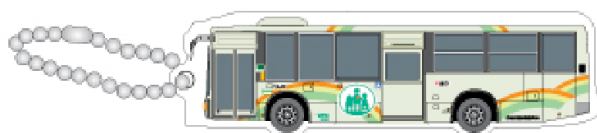
尼崎交通事業振興