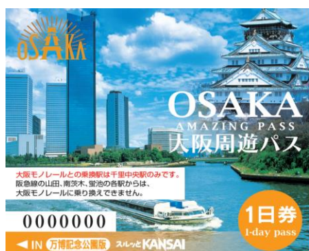
見本:大阪周遊パス(万博記念公園版)