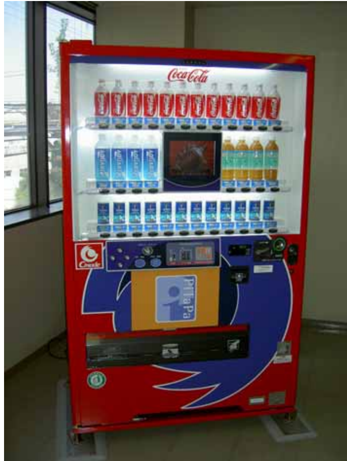
「PiTaPa」対応飲料自動販売機